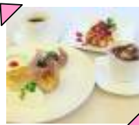
デザートも種類豊富♡