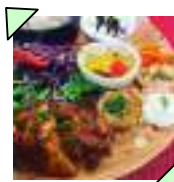
プレートランチ♪800円