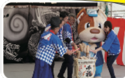
キュウキュウの鏡開きもネスト祭りの魅力ですね♪