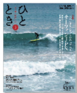
ウェッジ刊「ひととき 5月号」より転載

令和の時代になり色々な壁にぶつかる時期。それぞれの人に思い当たることがあれば重ねてみてはいかがでしょうか！