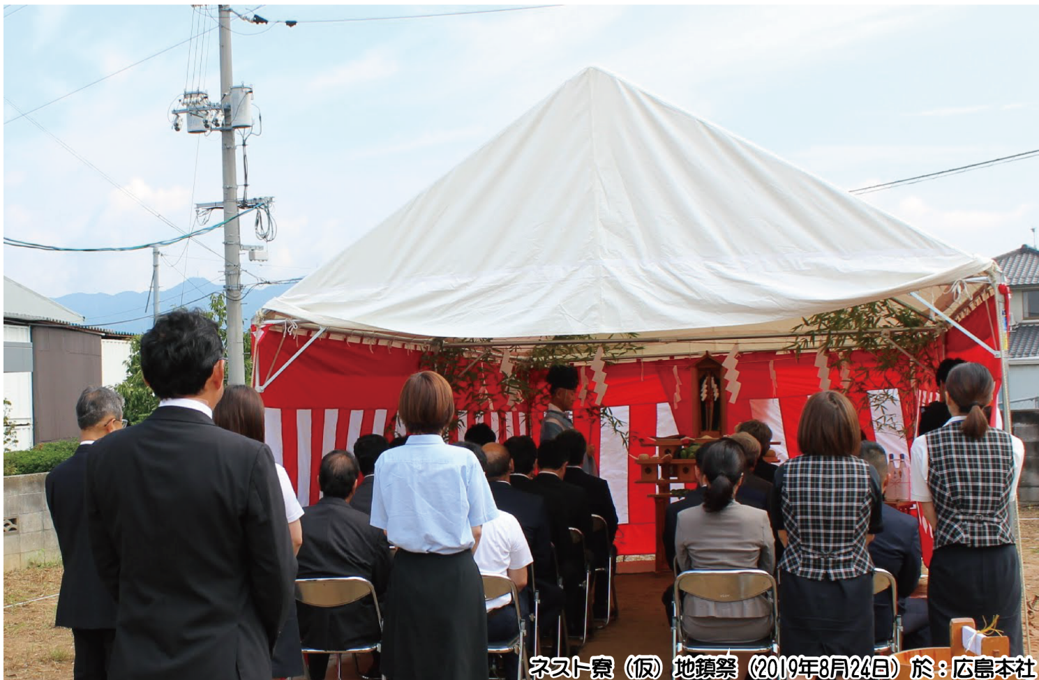
ネスト寮(仮)地鎮祭(2019年8月24日)於:広島本社