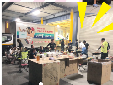
福山営業所社員とそとご家族♪ 盛り上がり過ぎて写真を撮るの 忘れちゃったそうです😅